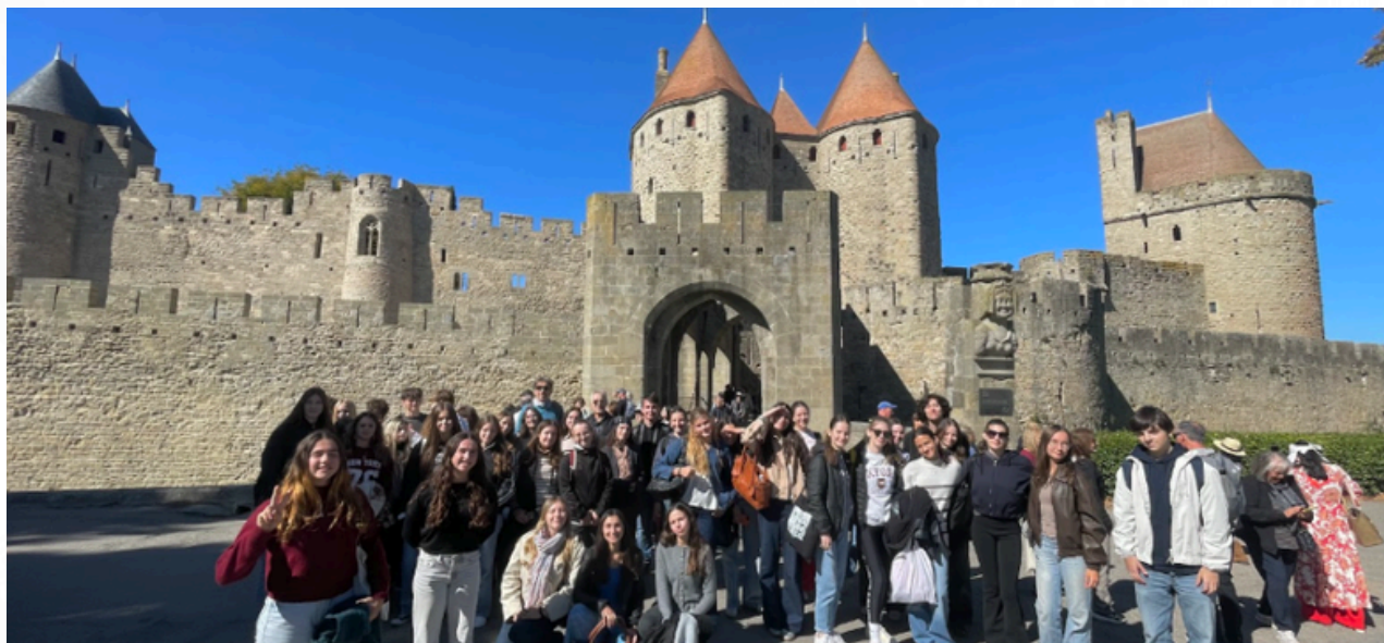
Le groupe devant les remparts de Carcassonne, le 06 Octobre 2025.

Nous avons ensuite prolongé la journée sur les plages de Narbonne, où quelques courageuses élèves se sont baignées tandis que les autres profitaient du soleil, avant de nous rendre dans le centre de Narbonne. Là-bas, nous avons visité la cathédrale Saint-Just et Saint-Pasteur.