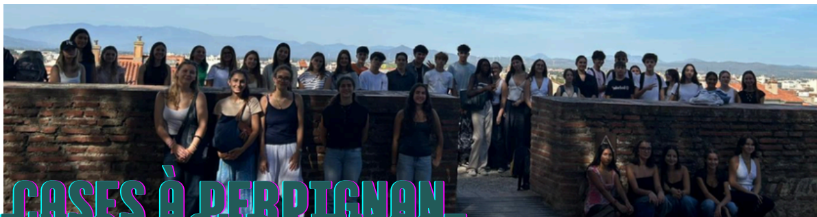
Photo de groupe depuis l'un des points hauts de Perpignan.